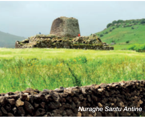
Nuraghe Santu Antine